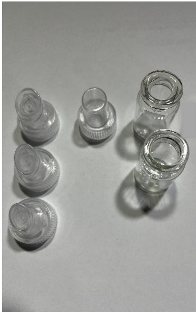
先端チップ、掃除用 先端チップ、ハイプレッシャースプレーボトル