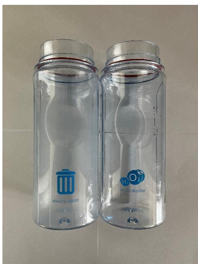
廃液ボトル、水素ボトル