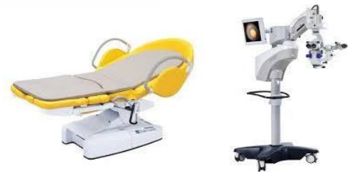
眼科・産婦人科機器